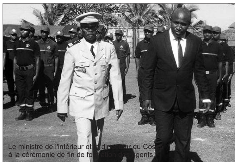
Le ministre de l'intérieur et le directeur du Cosep à la cérémonie de fin de formation des agents

Deux cents personnes composées de techniciens de la sécurité civile viennent de recevoir des attestations de formation de renforcement de capacités professionnelles et opérationnelles de la protection civile. En présence des hommes en kaki et du grand cadi, le ministre de l'intérieur annonce que grâce à cette formation, 16 unités locales seront ouvertes bientôt à Ngazidja. Mboudé et Hambou, leur installation est imminente.