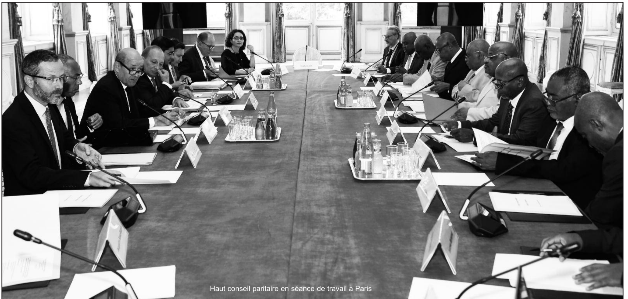
Haut conseil paritaire en séance de travail à Paris

Le gouvernement comorien est en passe de remporter un succès diplomatique sans précédent sur la question de Mayotte si l'on tient compte du document qui circule depuis quelques jours dans les réseaux sociaux. Un document faisant état de l'abolition du visa Balladur qui serait responsable de plusieurs morts dans le bras de mer séparant Mayotte des autres îles de l'archipel des Comores.