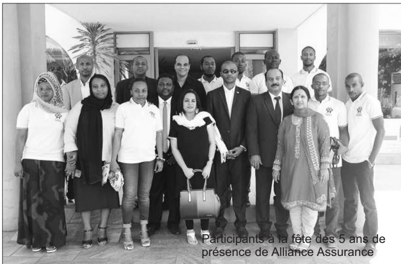
Participants à la fête des 5 ans de présence de Alliance Assurance