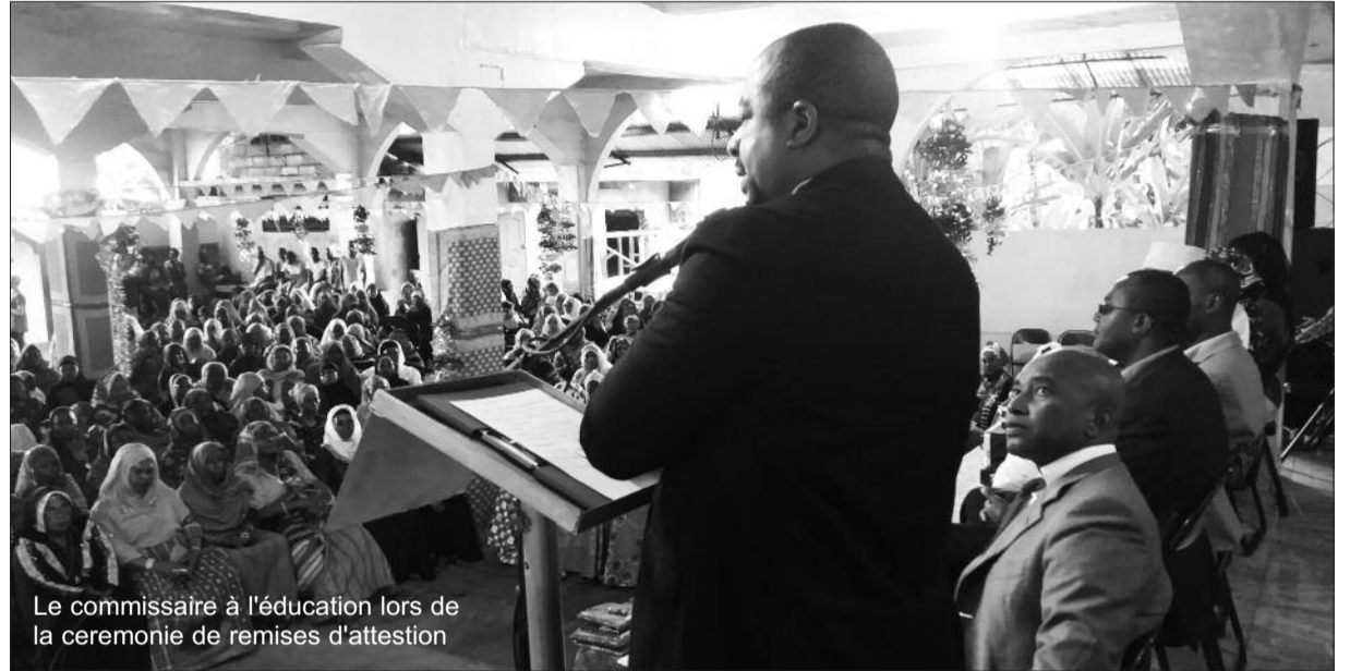
Le commissaire à l'éducation lors de la cérémonie de remises d'attestation